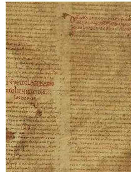
Etimologías de San Isidoro